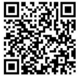
～ライン追加～ キャンセル連絡を受け付けています。 追加の際にフルネームを送信下さい